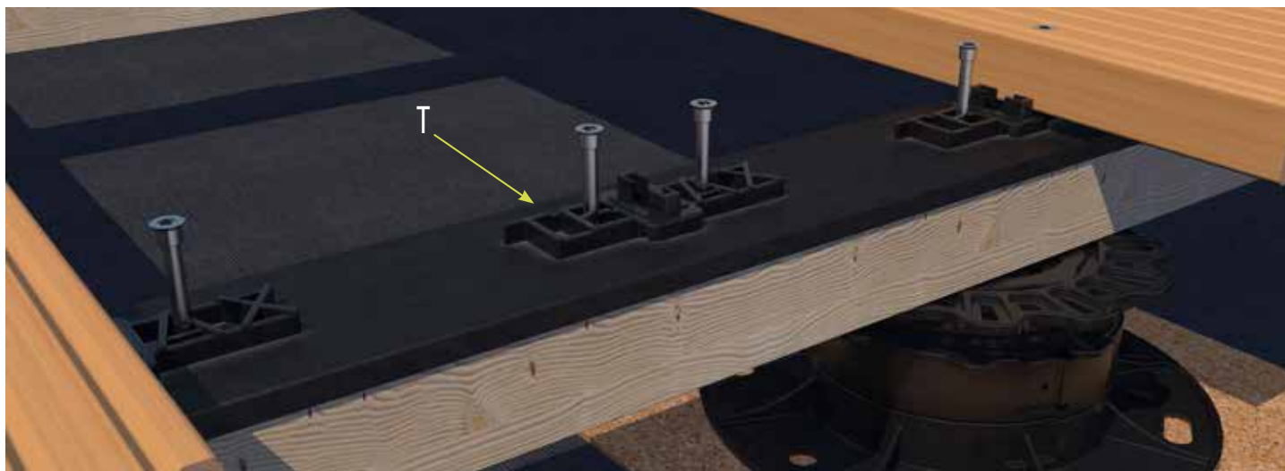
El distanciador Tenax (T) en una subestructura de madera