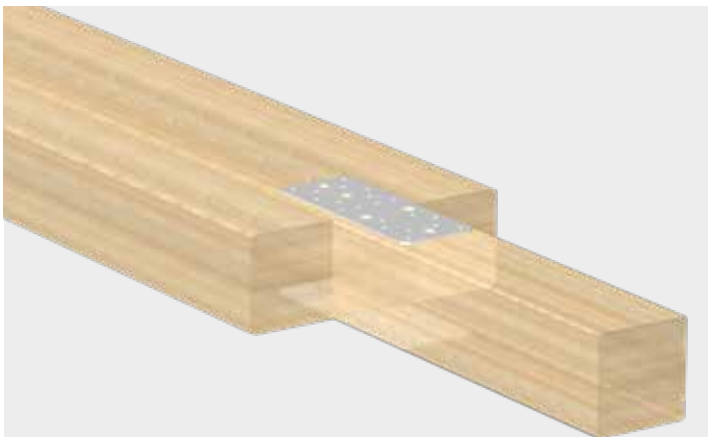
Unión rápida de dos elementos de madera con el conector plano pesado.