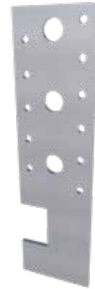
Anclaje para perfiles en T