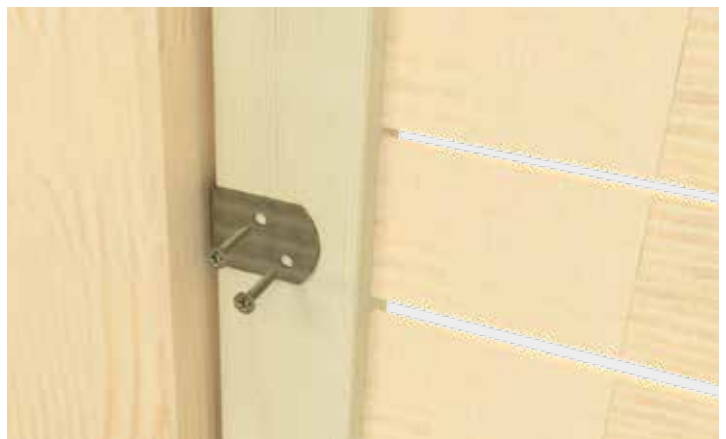
Montaje final de cada elemento de vallado