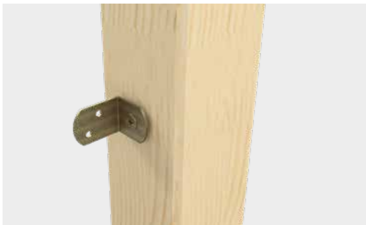
Fijación de la escuadra en el poste de vallado