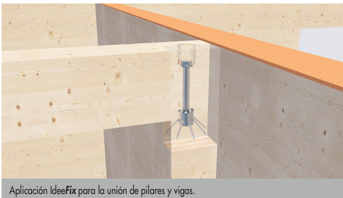
Aplicación Idee Fix para la unión de pilares y vigas.