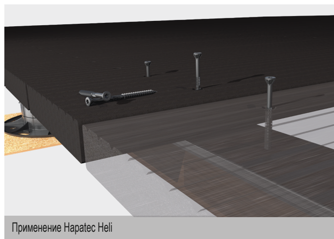
Применение Наратес Heli