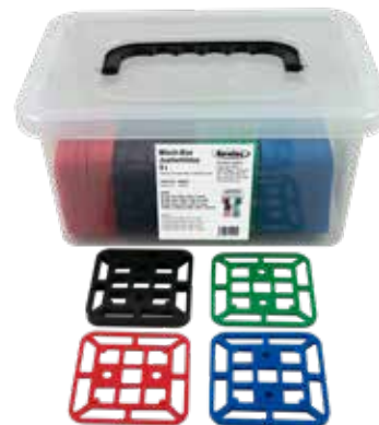
Регулировочные блоки 5 т, смешанны

Подходят для регулировки, в качестве подкладочного элемента или для выравнивания с точностью до миллиметра. Регулировочные блоки могут применяться повсеместно и являются универсальными элементами , используемыми при монтажных работах. Благодаря своей способности выдерживать большие нагрузки до 5 тонн, блоки подходят для широкого спектра применений . За счет распределения регулировочных блоков по цветам, предусмотренного в наших практичных наборах , вы сможете быстро определить нужную толщину и найти подходящий регулировочный блок.