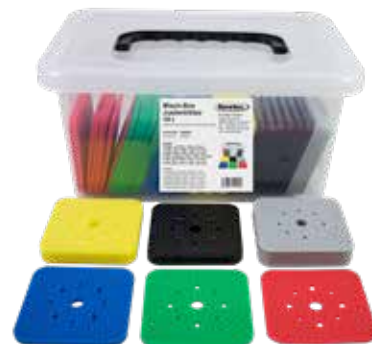
Регулировочные блоки 10 т, смешанные

Подходят для регулировки, в качестве подкладочного элемента или для выравнивания с точностью до миллиметра. Регулировочные блоки могут применяться повсеместно и являются универсальными элементами , используемыми при монтажных работах. Благодаря своей способности выдерживать большие нагрузки до 10 тонн, блоки подходят для широкого спектра применений . За счет распределения регулировочных блоков по цветам, предусмотренного в наших практичных наборах , вы сможете быстро определить нужную толщину и найти подходящий регулировочный блок.