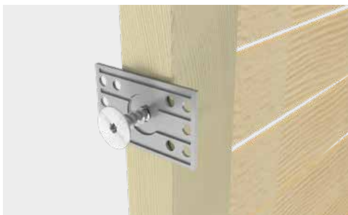
Montaż zestawu okuć do płotów plecionych na module ogrodzeniowym