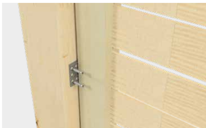
Późniejszy montaż modułu ogrodzeniowego na słupku ogrodzeniowym Zalecamy stosowanie 4 wkrętów Clickyfix na okucie