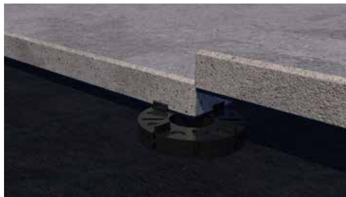
... lub dwójkami.