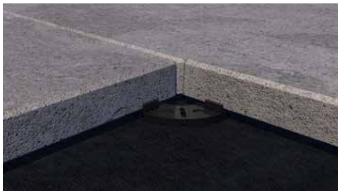
Płyty wsporcze można układać pod płytami kamiennymi pojedynczo ...