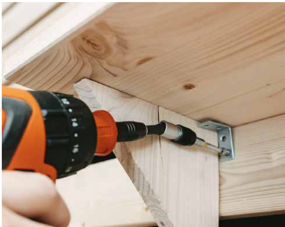
IMMAGINE RELATIVA ALL'UTILIZZO

Esempio di utilizzo: fissaggio di un angolo in una zona difficile da raggiungere mediante il portainseriti orientabile.