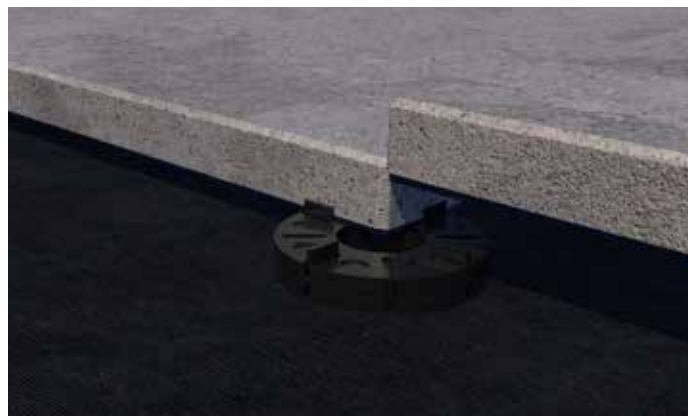
... o doppio.