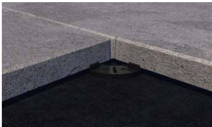
Sotto le lastre, il portalastra può essere utilizzato singolo...