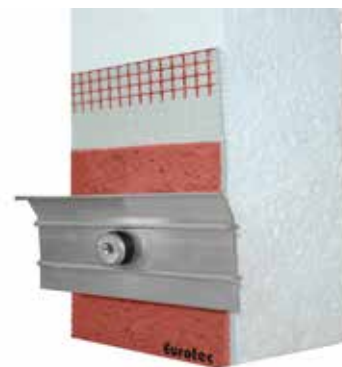
TABELLA DEGLI ARTICOLI

ETICS, pannelli in polistirene (EPS, XPS), pannelli in espanso rigido, pannelli in polistirolo