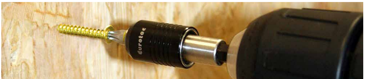
OSB Fix lors du vissage