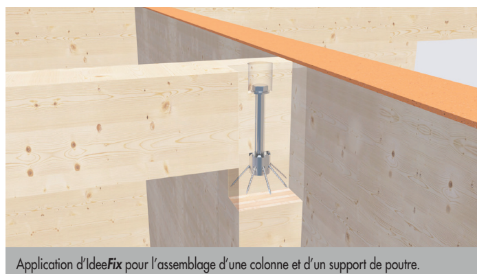
Application d'IdeeFix pour l'assemblage d'une colonne et d'un support de poutre.