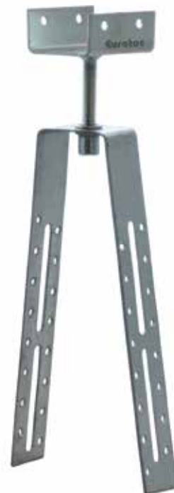
Tableau des articles