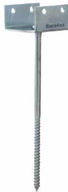
Tableau des articles