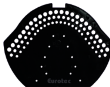
Tableau des articles