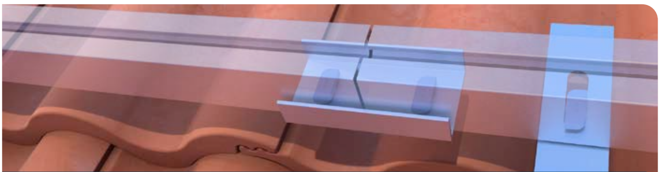
Verbindung von zwei Montageprofilen mittels des U-Profilverbinders.