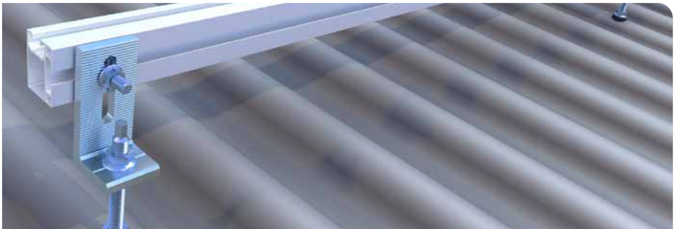
Der L-Adapter zur Montage einer Solarbefestigung.