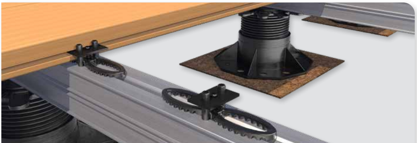
Deckclip als nicht sichtbare Befestigung

Zur Kombination mit GridDeck, DiviDeck oder Groove Stick. Lieferung erfolgt inkl. Schrauben