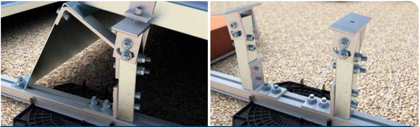
Gelenk für Modulaufständerung hinten im montierten Zustand.