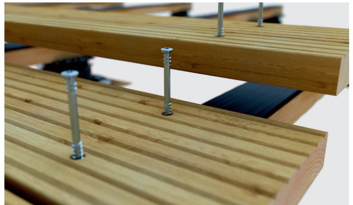
Anwendungsbeispiel der Terrassotec Zierkopf in einer Terrassendiele.