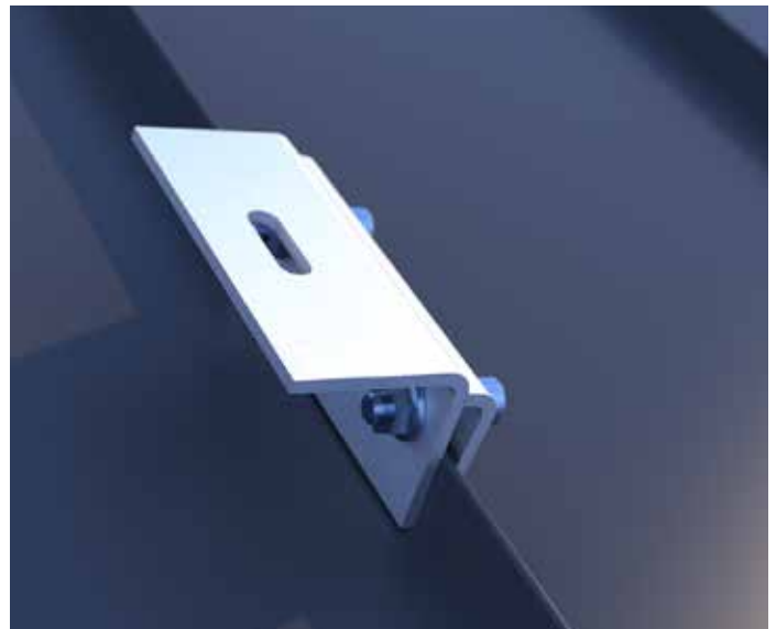
Montage der Stehfalzklemme auf der Falz des Stehfalzdaches.