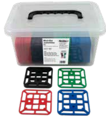
Misch-Box Justierklötze 5 t