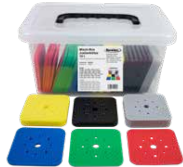
Misch-Box Justierklötze 10 t