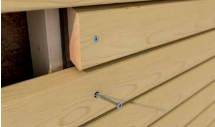
Anwendungsbeispiel der Hobotec.