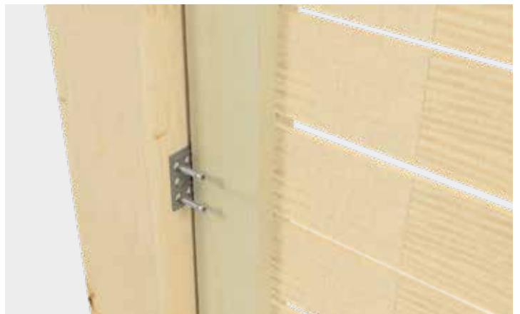
Anschließende Montage des Zaunmoduls an einem Zaunpfosten Wir empfehlen pro Beschlag 4 Clickyfix-Schrauben einzusetzen